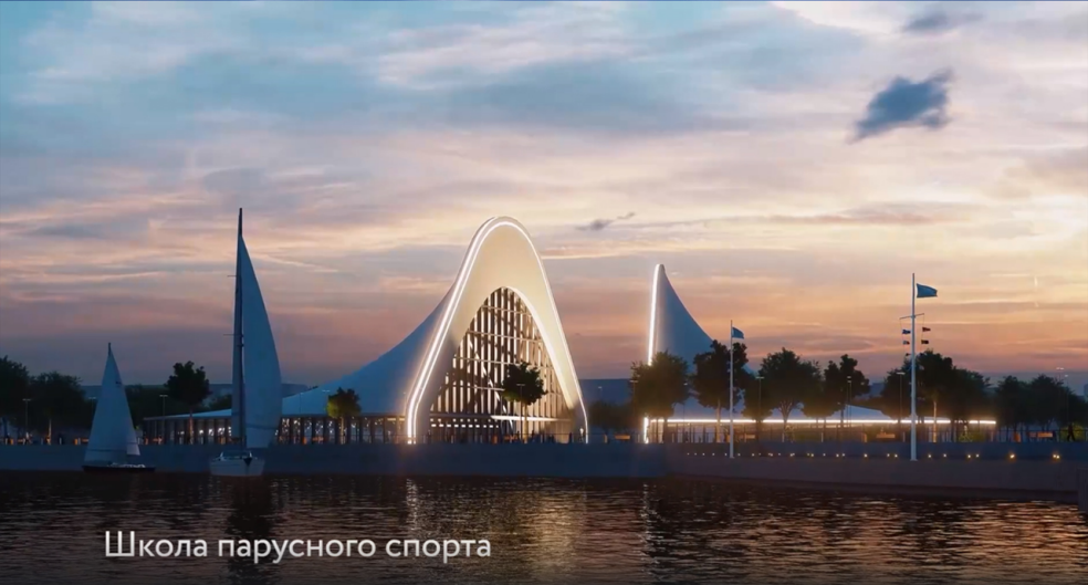
Школа парусного спорта